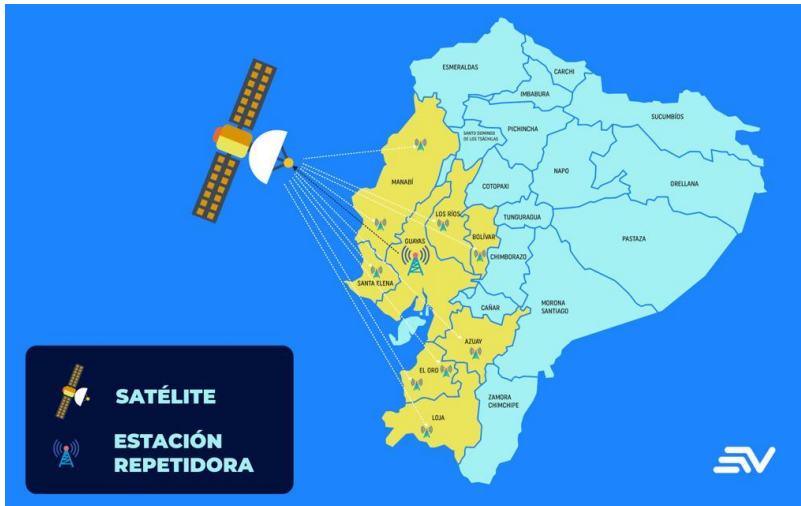
Cuadro 1. Sistema de radiodifusión por televisión abierta – Ecuavisa

Texto de Lectura: Corporación Ecuatoriana de Televisión C. Ltda., cuenta con matriz en la ciudad de Guayaquil y varias repetidoras en la región centro sur del país, de las cuales se distribuyen en las provincias de Guayas, Manabí, Los Ríos, Santa Elena, El Oro, Bolívar, Azuay y Loja. Conforme podemos apreciar en el gráfico.